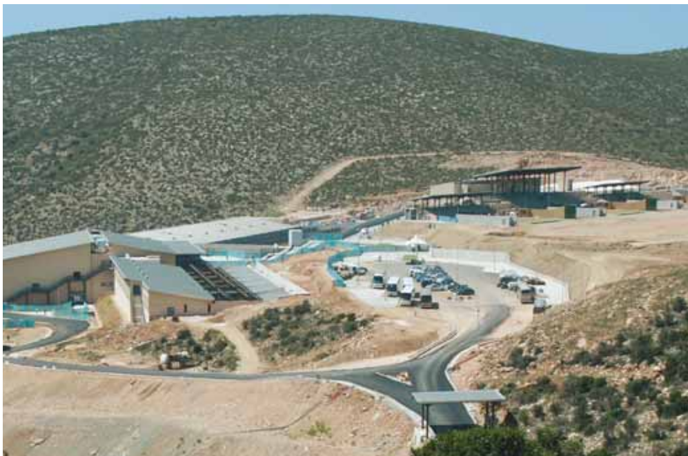
Das Schiesszentrum «Markopoulo» in Athen

Bisher unerreichte, direkte Information der Zuschauer sowohl in den Hallen als auch weltweit mittels elektronischer Medien.