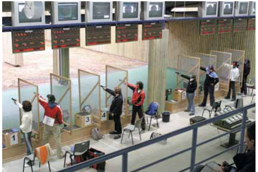
Dank Zuschauerbildschirmen und Anzeigetafeln waren die Zuschauer stets aktuell informiert.