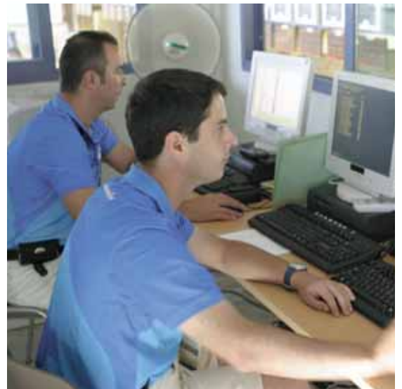
Die mit 80 Anlagen bestückte 10-Meter-Halle während eines Luftgewehrwettbewerbes und Resultatauswertung im 10-Meter-Kontrollraum.