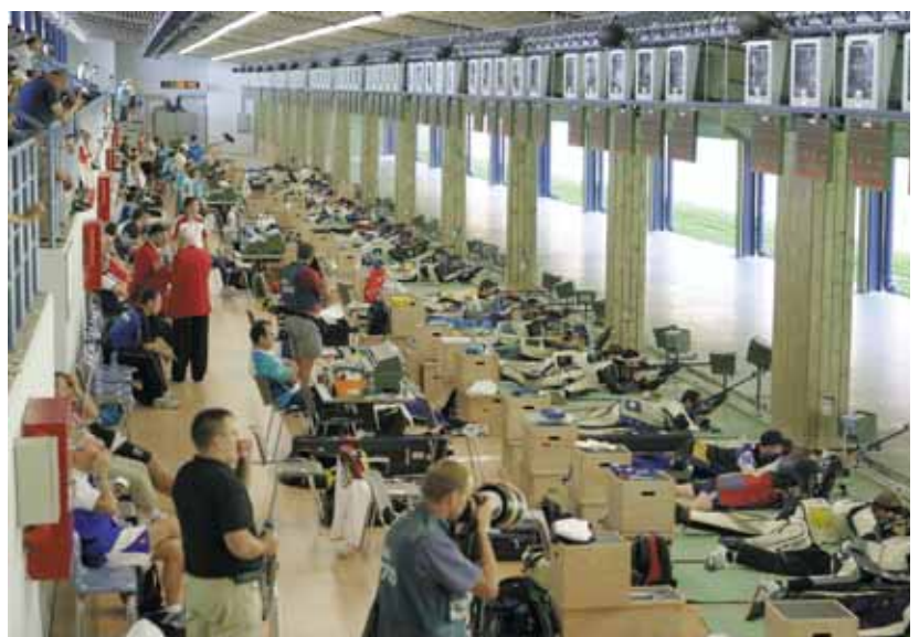
3 x 40-Schuss-Dreistellungsmatch in der 50-Meter-Halle mit 80 Anlagen